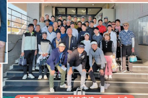
第3回イワサキ親睦交流ゴルフ大会