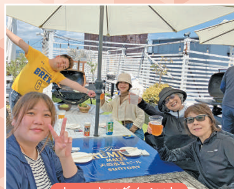
ウォーキングイベント