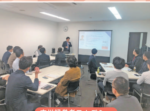
吉川経営者アカデミー