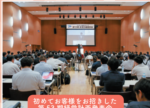
初めてお客様をお招きした 第53期経営計画発表会