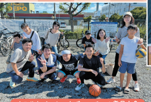
イワサキバスケットボールチーム発足!?