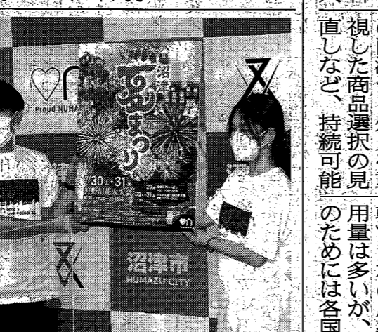
夏まつりTシャツを着てポスターを掲げる市職員＝市役所で

沼津夏まつり・狩野川花火大会が30日と31日、3年ぶりに開催される。向まつり実行委員会では、ポスター1200枚を印刷し、単位自治会や商店街、民間企業、公共施設などに配布して貼付してもらいアピール。また夏まつりTシャツを1000枚製作し、1枚1000円で販売している。